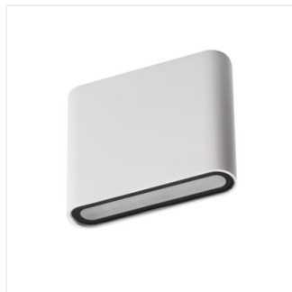
GARTO LED EL 8W-W