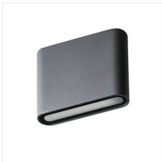
GARTO LED EL 8W-GR